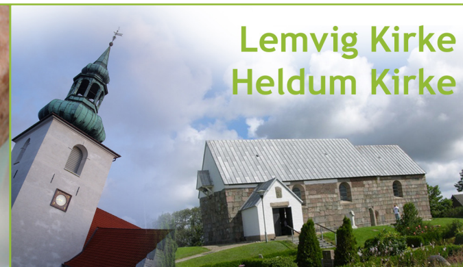
Lemvig Kirke Heldum Kirke